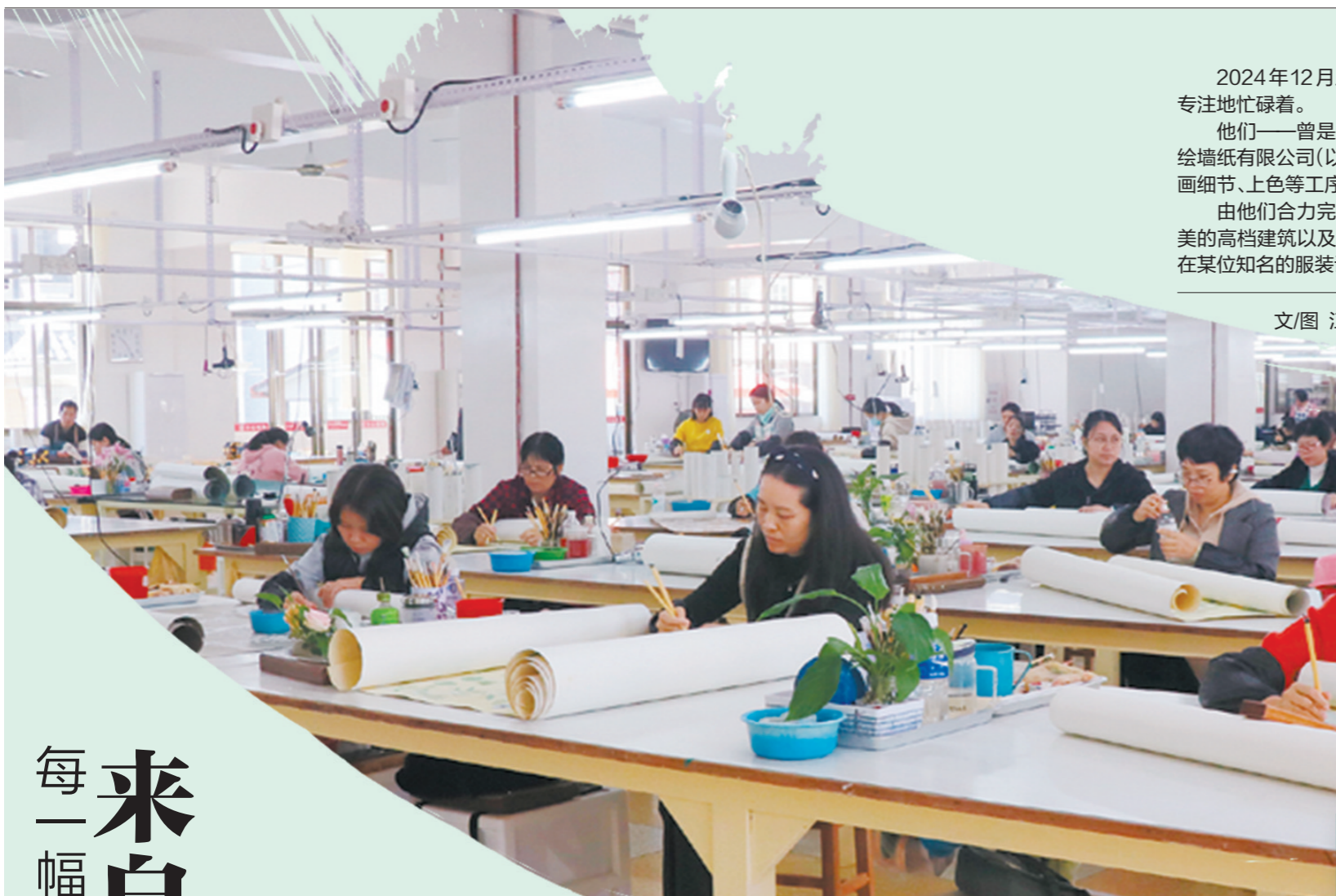
画师们在各自岗位专注地画画。