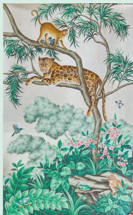
极具中国意韵的手绘墙纸