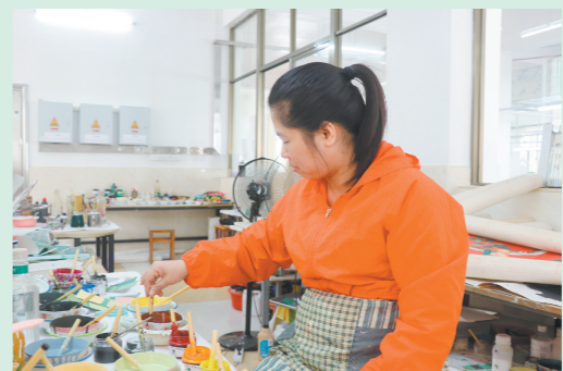
为达到最佳效果,调配一个颜色通常要2个小时。