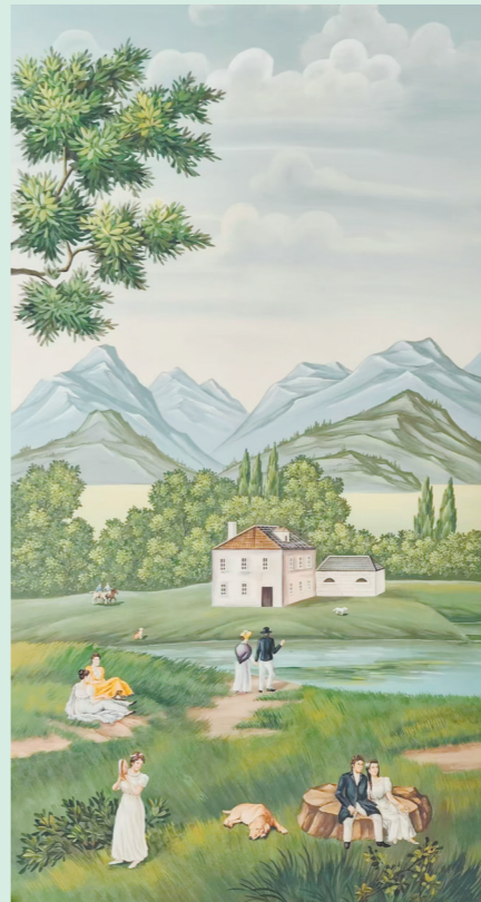
欧美风格的手绘墙纸