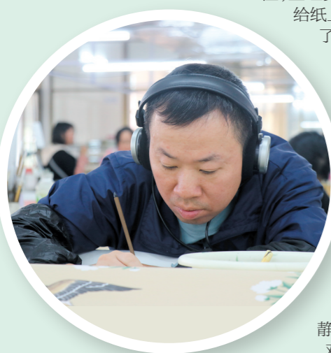
↑画师戴着耳机,可以让精神更专注。

一幅墙纸,画满交融,画下了中华传统文化与西方现代设计相结合的魅力,也画下了侨乡江门台山一群普通人通往世界的梦想。