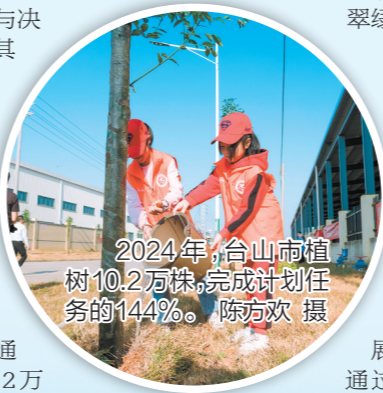
2024年,台山南植树10.2万株,完成计划任务的144%。

在绿美台山生态建设的推动下,台山“天蓝、地绿、山青、水秀、景美”的生态环境愈发迷人。同时,台山市积极推动绿色生态与经济融合发展,通过发展林下经济、乡村旅游等方式,实现生态产品的价值转化,为村民带来了实实在在的收益。