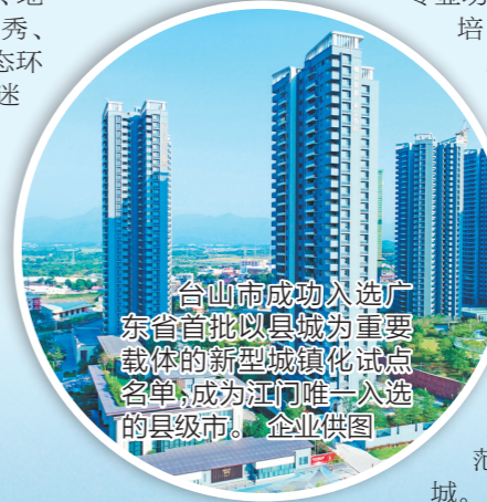
台山南成功入选广东省首批以县城为重要载体的新型城镇化试点名单,成为江门唯一入选的县级市。

展望未来,如何实现从“试点”到“标杆”的跨越?台山已明确方向——按照“以加快发展农产品主产区、专业功能县为主,以积极培育重点生态功能区县为轴”的功能定位和发展方向,推动以县城为重要载体的新型城镇化建设,全力打造珠三角先进装备制造基地、现代服务业集聚区、现代农业展示示范区、历史文化名城。