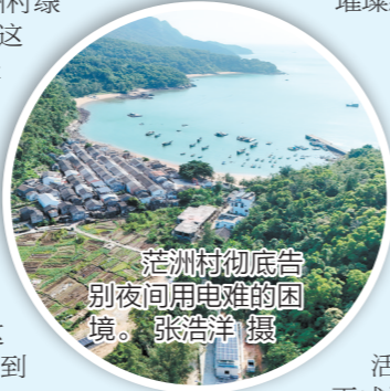
茫洲村彻底告别夜间用电难的困境。

2024年,台山市持续加大民生投入,通过一系列民生实事项目,进一步提升群众的生活品质和幸福感,为群众营造更加宜居宜业的生活环境。