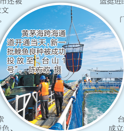
黄茅海跨海通道开通当天,新一批鮰鱼良种被成功投放至“台山1号”。

12月11日,黄茅海跨海通道开通当天,新一批重量超过2万公斤的鮰鱼良种再次被成功投放至“台山1号”。未来,这些来自台山海洋牧场的渔获,将通过黄茅海跨海通道,源源不断地送达大湾区居民的餐桌。