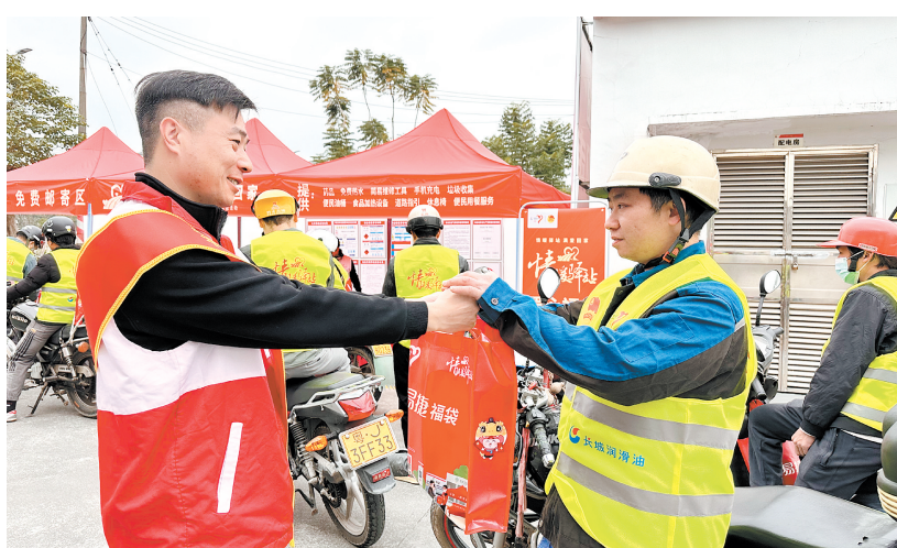
中石化员工向返乡旅客送上福袋。

江门日报讯（文/图 记者/王建华 通讯员/严凯茵 邓婉君）1月14日，春运首日，中国石化鹤山龙口加