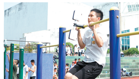
引体向上的评分标准近年根据实际情况不断调整。

江门日报讯(文/图 记者张翠玲)记者从市教育局获悉，近日，市教育局印发《2025年江门市初中学业水平考试体育与健康科目考试实施意见》(以下简称《意见》)，统一考试和缓考安排在4月1日—5月30日。其中，引体向上(男生)的评分标准有微调，同时作出了“外地返回江门学生和往届生”体育考试成绩评定。