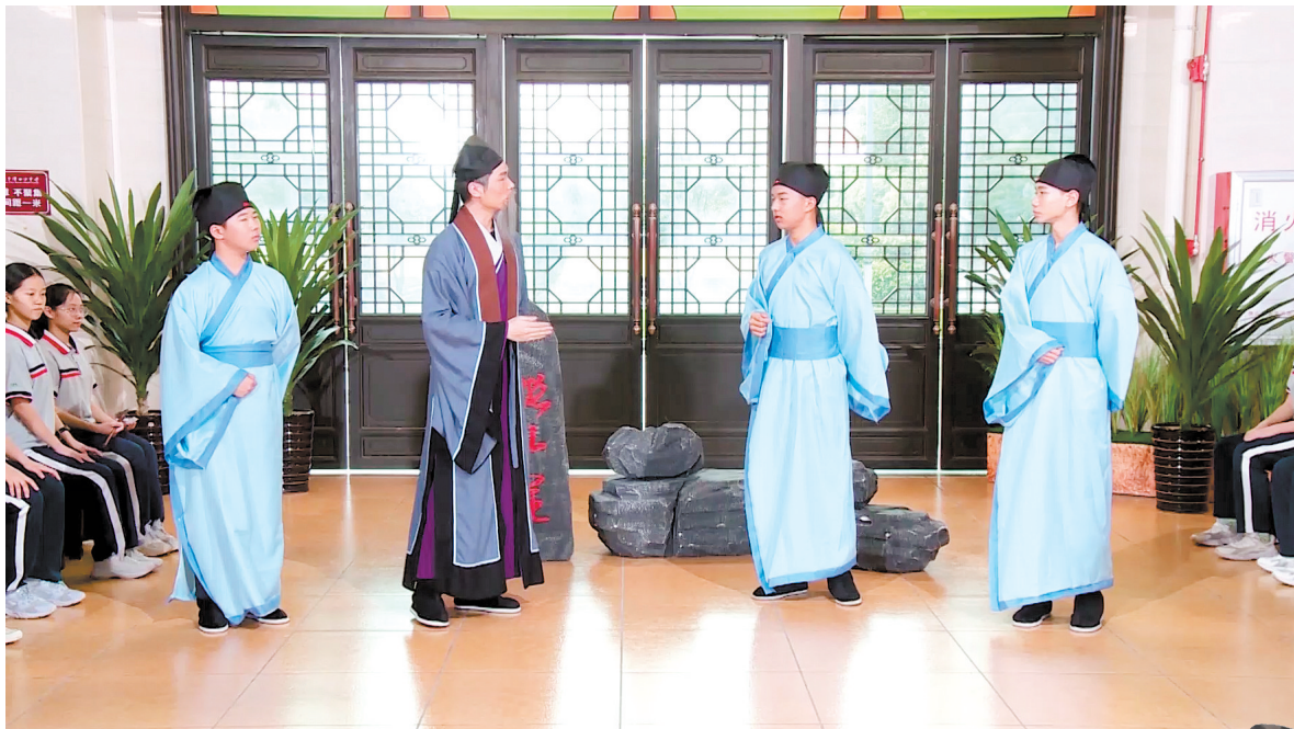
“穿越”课堂高度还原古代的场景。

作为一所以陈白沙命名的中学，陈白沙中学十分明确，白沙先生的经历、哲学思想、教育精神等都是学校宝贵的“财富”，为了让学生沉浸式感受白沙先生的教育思想，在刚结束的学期，陈白沙中学通过多种方式开展“穿越”课堂系列活动。1月11日，寒假前最后一次“穿越”课堂活动圆满结束，学生们再一次身临其境，和“白沙”先生面对面交流，收获广泛好评。教育人士认为，“穿越”课堂活动，对于中小学语文、历史等科目教学而言，具有重要的启示意义。