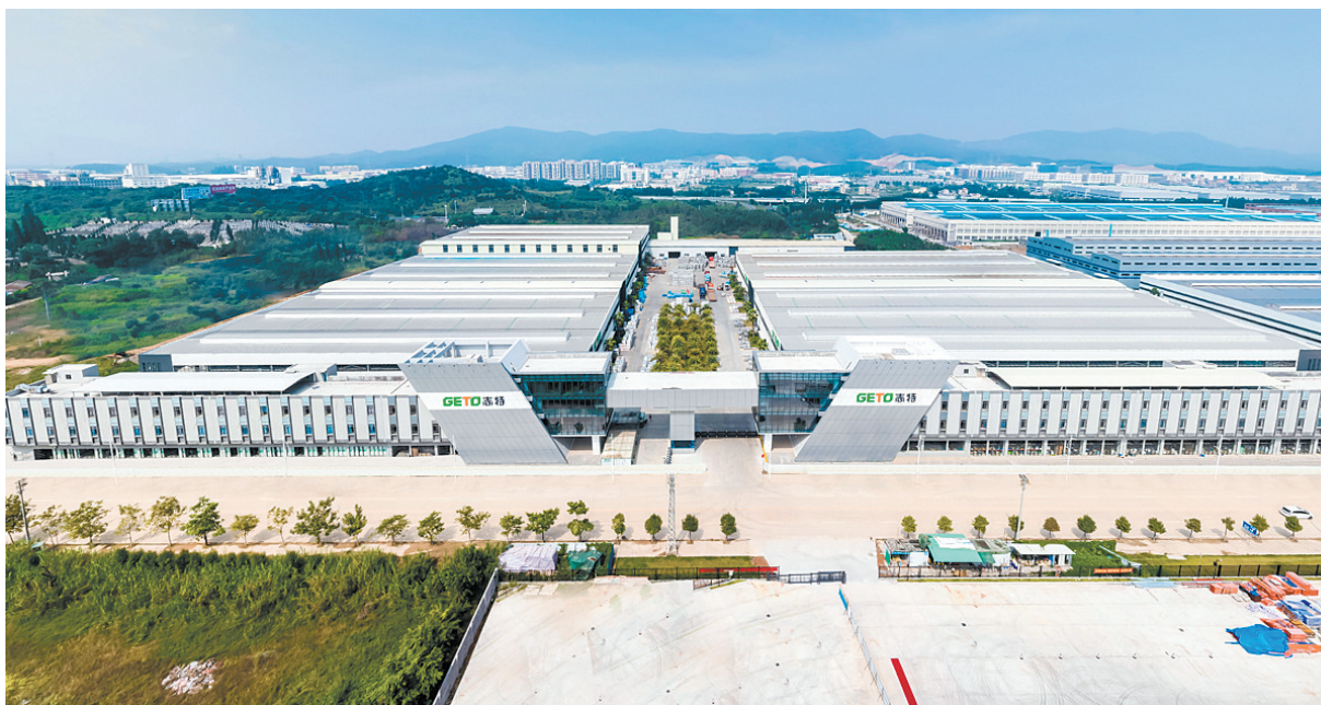
志特集团在开平市翠山湖高新区成立江门志特新材料科技有限公司，投资新材料项目，总投资约10.1亿元，主要生产绿色环保建筑铝合金模板，目前首期项目、二期项目均已投产。