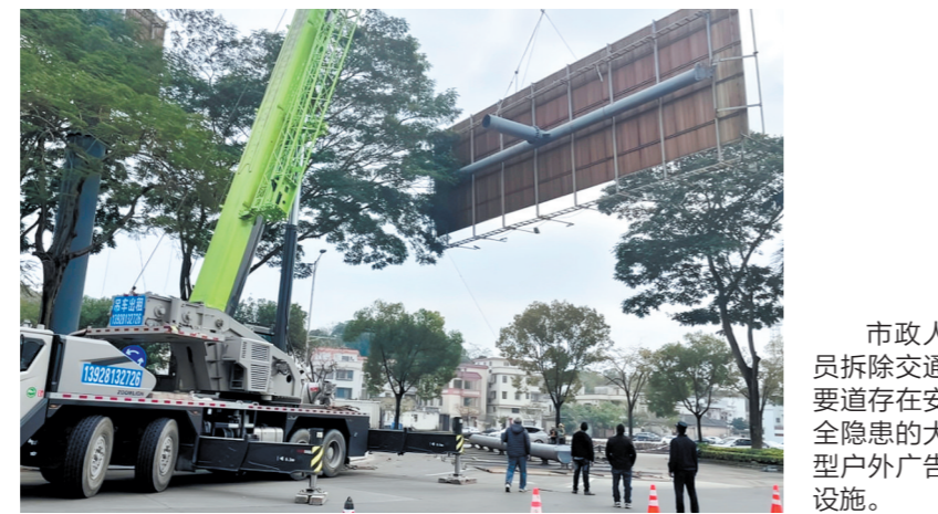
市政人员拆除交通要道存在安全隐患的大型户外广告设施。

本次集中整治行动，全市共检查户外广告和招牌设施2100个，清理整治不规范和存在安全隐患的户外广告、招牌130个，并对17个大型户外广告设施