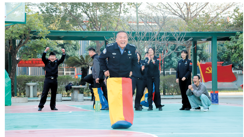
大家聚在一起热热闹闹、欢乐开怀。

江门日报讯（文/图 记者/朱磊磊 通讯员/于鑫）“加油！好球！”“坚持住，我们要赢！”1月20日，珠海边检总站台山边检站营区外传来阵阵呐喊助威声，原来是该站正在开展“蛇来运转 火力全开”警营春节系列活动，让警营的氛围变得轻松活泼。