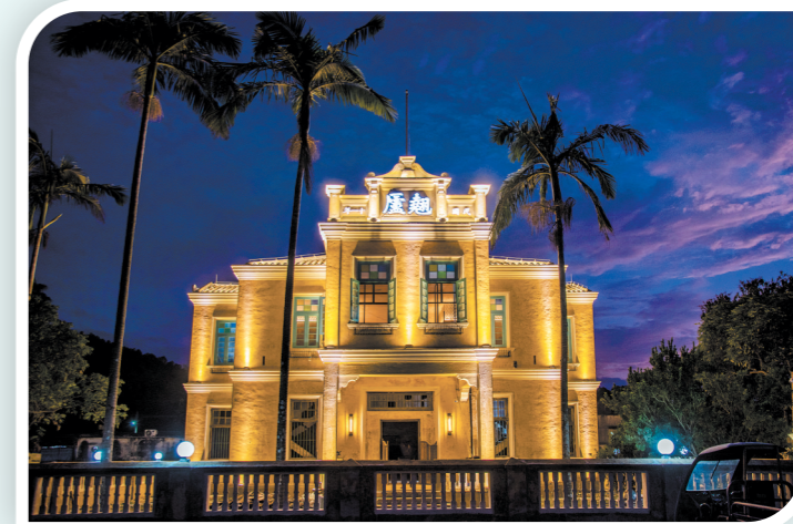
修旧如旧、活化利用做民宿的台城官步村翘庐1922。