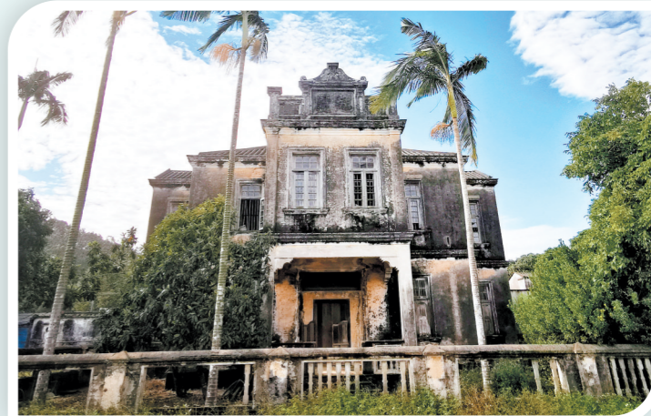
活化前的台城官步村翘庐1922。