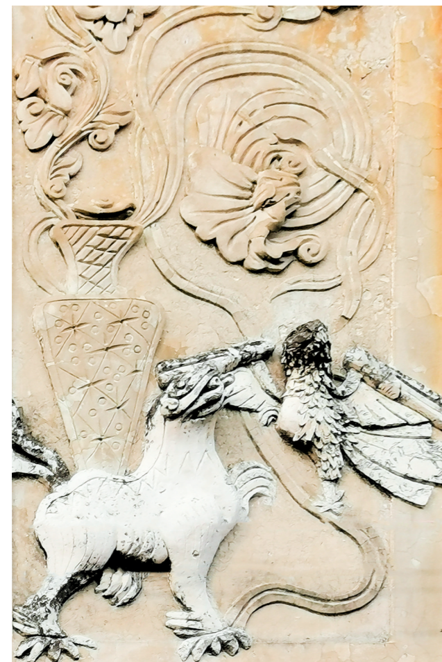
白沙镇龙安村水泥雕是台山华侨建筑的一大特色。