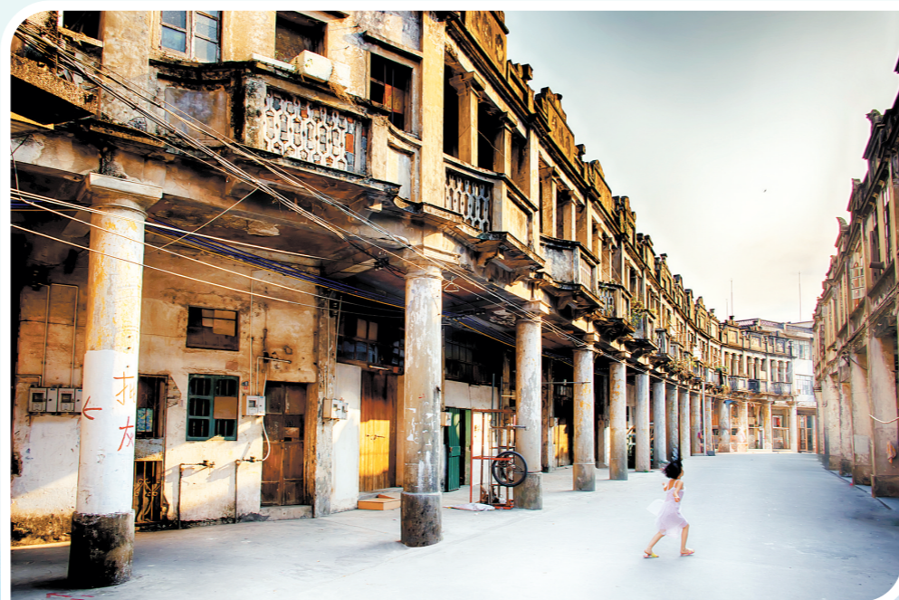
建于1927年的白沙镇健康路骑楼群形成一个古朴侨城，散发着独特的魅力。