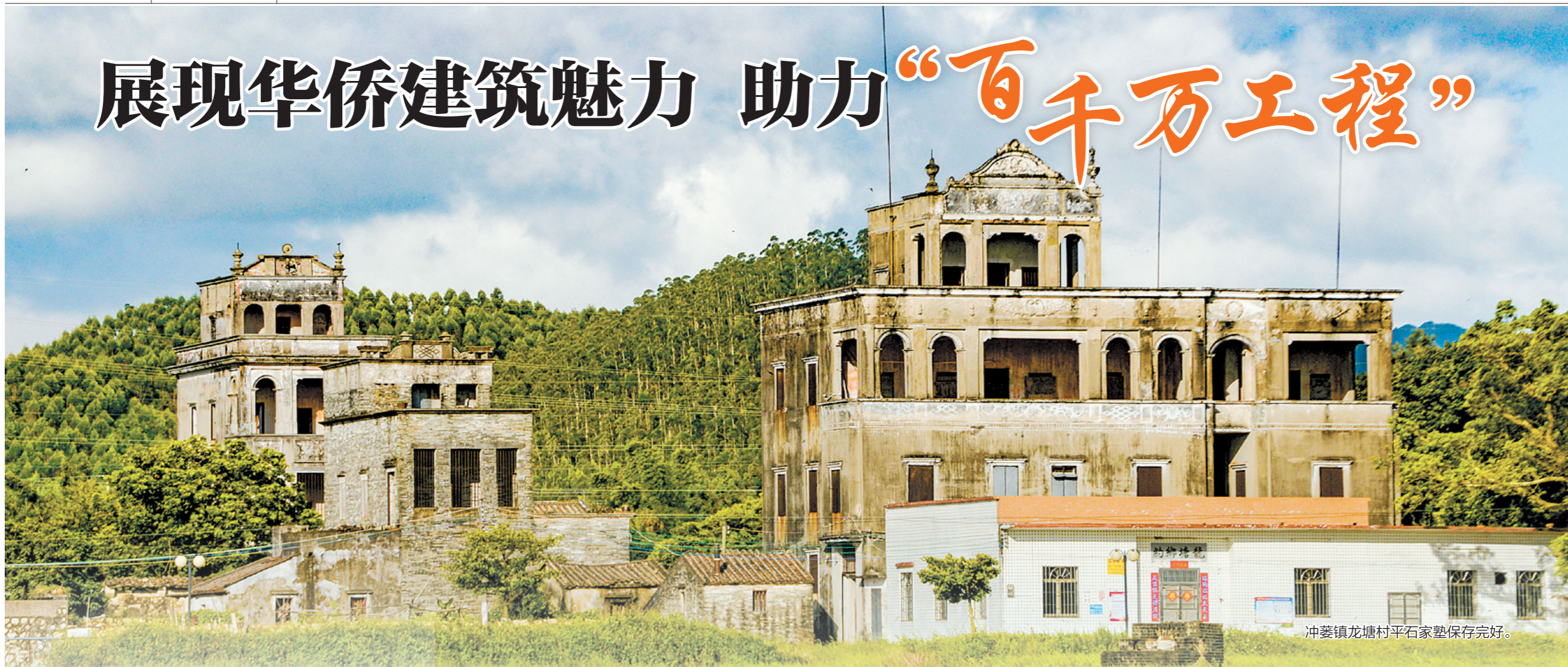
冲蒺镇龙塘村平石家塾保存完好。