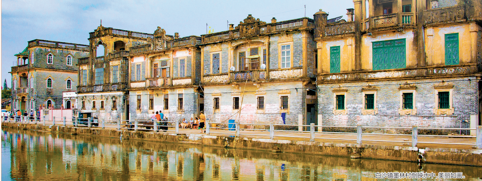
白沙镇墨林村倒影映水中，美丽如画。