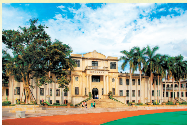
台山一中教学大楼。