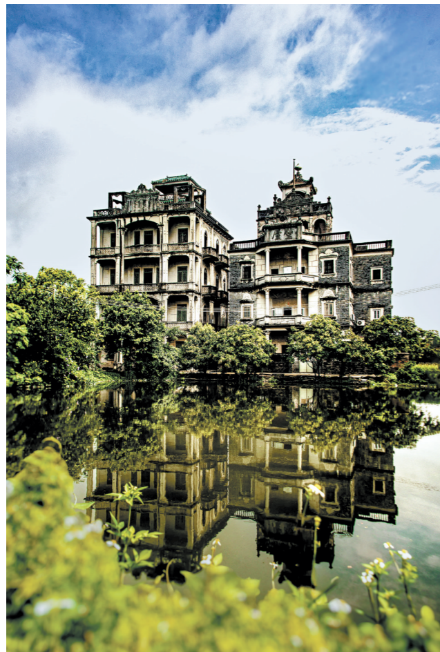
水步镇双龙村耀庐、碧庐。