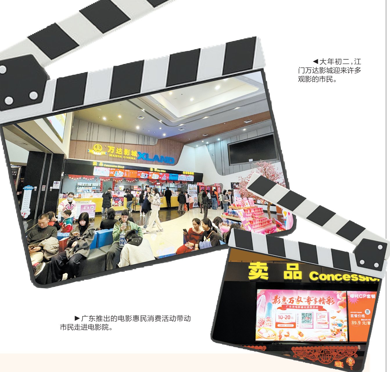
广东推出的电影惠民消费活动带动市民走进电影院。