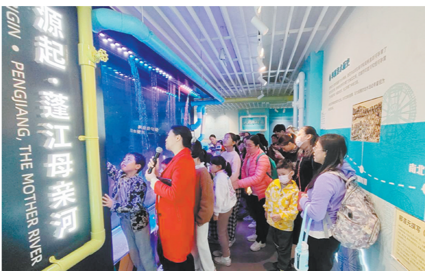
参与者深入了解本地治水历程以及水系情况。