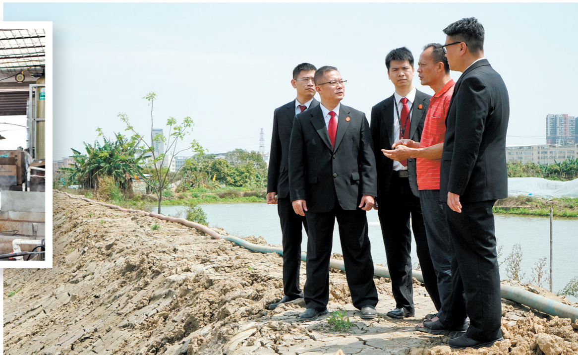
← 执行法官在田间地头向当事人了解案情。