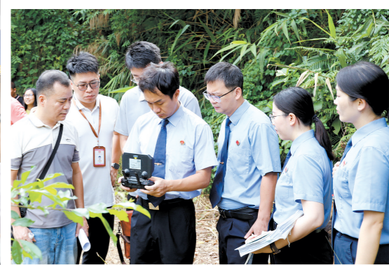
↑ 检察干警借助无人机开展调查取证工作。