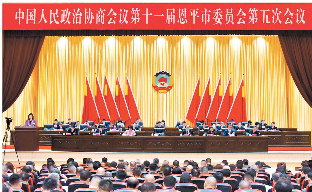
昨日上午,中国人民政治协商会议第十一届恩平市委员会第五次会议开幕。

报告指出,2025年是“十四五”规划收官、“十五五”规划谋篇之年,也是恩平市政协成立45周年,做好今年政协工作意