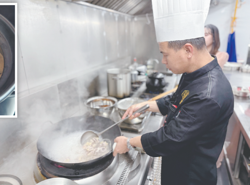
厨师严格精选原材料,确保每一道菜都是选用新鲜地道的食材。

据悉,三合煮鸡酒是台山的一道传统名菜,在三合镇更是家喻户晓。这道菜品不仅有驱寒祛湿的功效,还承载着当地喜庆的传统文化意义。在古代,产妇生孩子后,家人会准备煮鸡酒来补血、调