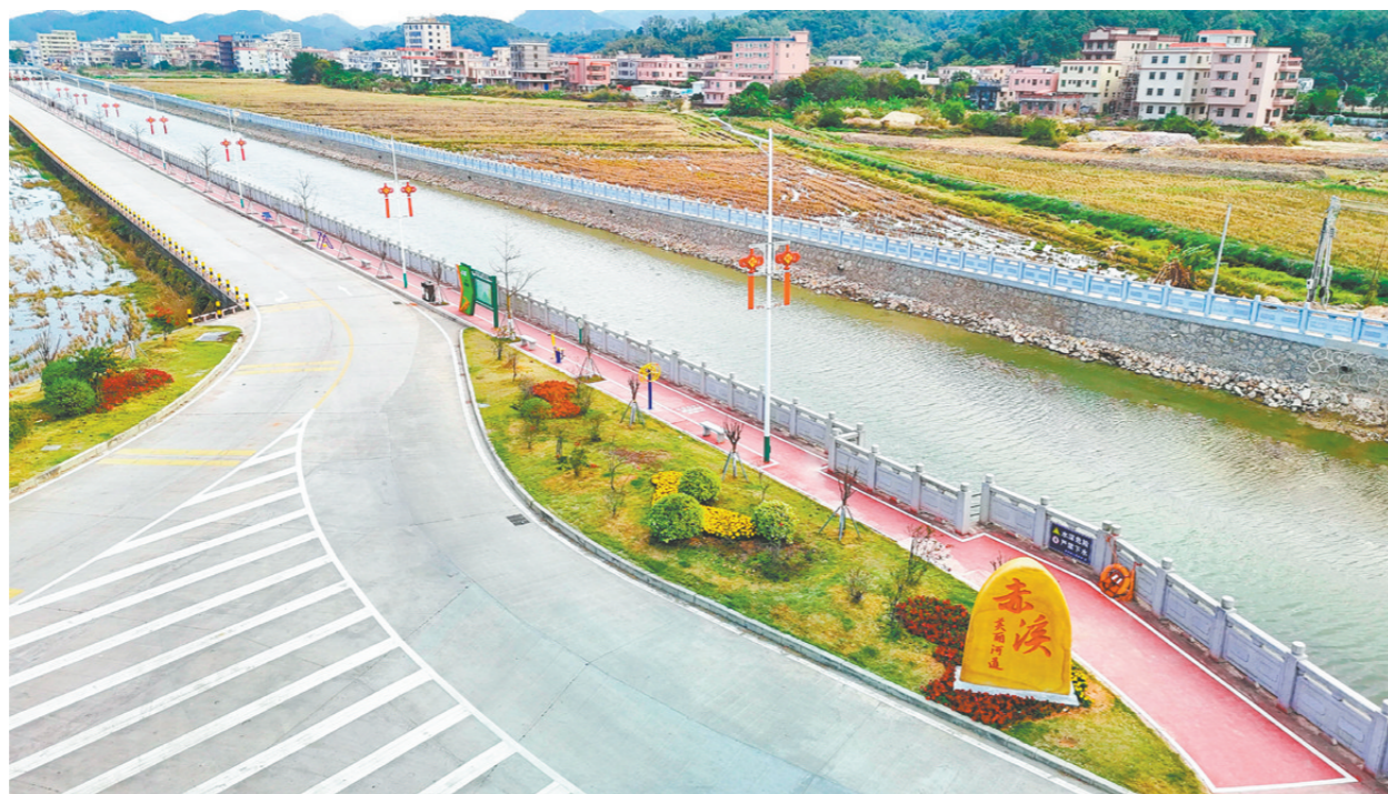
赤溪镇通过岸线整治、慢行系统建设、危桥改造等一系列措施,让白宵河实现从单一防洪功能向综合生态廊道的华丽转身。