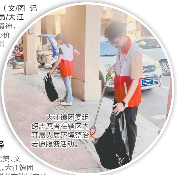
大江镇团委组织志愿者在辖区内开展人居环境整治志愿服务活动。

为进一步落实对特定人群的关怀,大江镇团委组织志愿者开展春季慰问活动。志愿者们带着春风暖意,为困难群众送上丰富的慰问品,仔细询问他们的生活状况和实际困难,向他们宣传相关的社会救助政策,帮助他们申领符合条件的补贴,切实将惠民政策落实到千家万户。今年3月学雷锋志愿服务月主题活动中,大江镇团委组织志愿者共走访低保户63