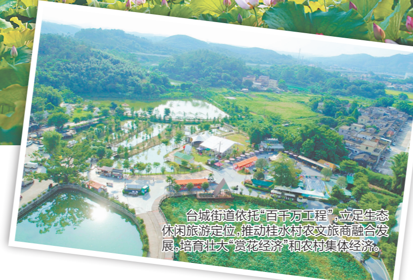
台城街道依托“百千万工程”，立足生态休闲旅游定位，推动桂水村农文旅商融合发展，培育壮大“赏花经济”和农村集体经济。

荷香深处，振兴之路正宽。这个夏天，让我们共赴桂水村，见证乡韵悠长，感受乡村脉动。