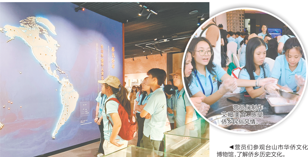
营员们制作艾糍美食，感受侨乡民俗风情。