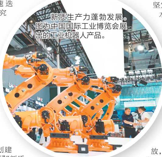
新质生产力蓬勃发展。图为中国工业博览会展出的工业机器人产品。