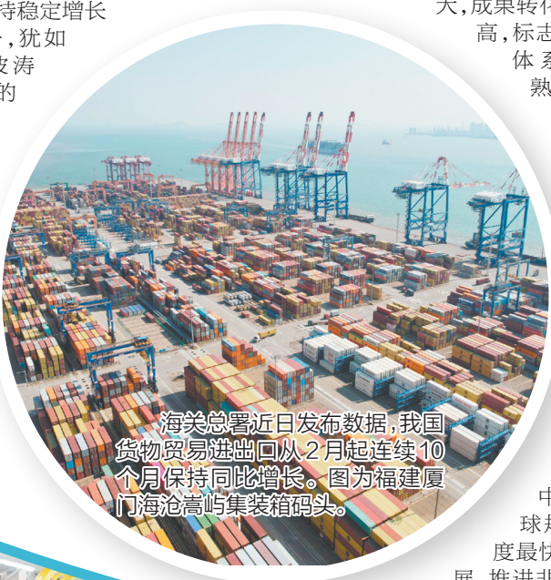
海关总署近日发布数据,我国货物贸易进出口从2月起连续10个月保持同比增长。图为福建厦门海沧高崎集装箱码头。

站在“十四五”收官与“十五五”开篇的交汇点上,面对充满不确定性的世界,中国经济正以稳健的基本面、强劲的创新驱动力、坚定的开放姿态,为全球发展注入稀缺的确定性。这艘承载着14亿多人民美好向往、寄托着世界共同繁荣愿景的巍巍巨轮,必将穿越激流险滩,劈波斩浪,驶向更加壮阔的未来。