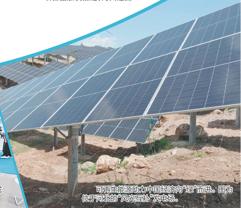
可再生能源助力中国经济向“绿”而进。图为位于河北的“风光互补”发电场。