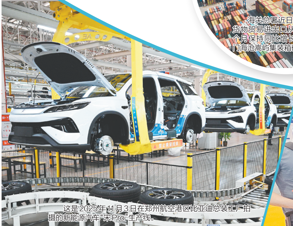
这是2025年11月3日在郑州航空港区比亚迪总装工厂拍摄的新能源汽车“宋Pro”生产线。