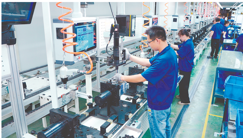
近年来,江门金属制品、家电、摩托车等产业持续推进技术改造和数智化转型。图为珠峰摩托发动机生产线。