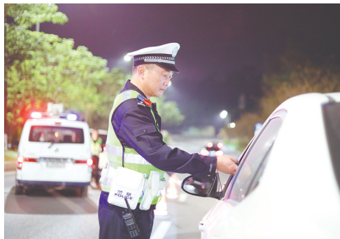
行动采取“设卡检查+流动巡查”相结合的方式。

江门日报讯(文/图 记者/张华炽 通讯员/林艳)为防范冬季道路交通事故,严厉打击酒驾醉驾等易肇事肇祸交通违法行为,12月12-14日,开平市公安局连续三天开展整治酒驾醉驾统一行动,织密道路交通安全防护网,最大限度保障群众出行安全。