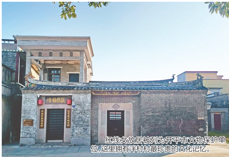
红线女故居被列为开平市文物保护单位,这里拥有洋村最珍贵的文化记忆。

从水口洋村村青砖黛瓦间的乡音浸润,到海内外舞台上的艺术革新,誉为“南国红豆”的粤剧大师红线女将侨乡文化的兼容特质、坚韧品格与家国情怀熔铸于艺术生命,践行着“我的生命属于艺术,我的艺术属于人民”的赤诚誓言。12月11日,纪念红线女诞辰100周年专场演出暨第二届“中国侨都·红线女粤剧艺术周”启动,这份跨越世纪的文化情缘在侨乡大地续写着传承与创新的时代华章。