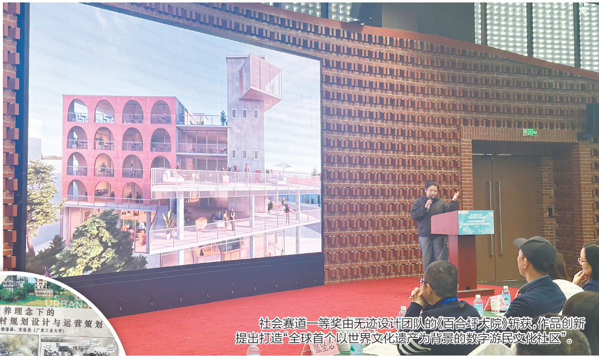
社会赛道一等奖由无迹设计团队的《百合圩大院》斩获,作品创新提出打造“全球首个以世界文化遗产为背景的数字游民文化社区”。

作为此前连续举办四届的“设计激活世遗”国际文创设计大赛的延续,2025开平市精品民宿设计揭榜挂帅大赛首次将主题聚焦民宿设计,从世界文化遗产地周边以及农文旅民