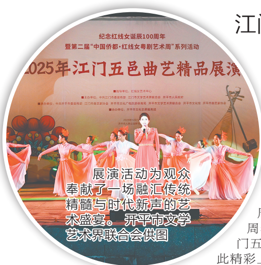
纪念红线女诞辰100周年暨第二届“中国侨都·红线女粤剧艺术周”系列活动

此次活动是对红线女大师百年诞辰的诚挚纪念,也是对金秋敬老传统的温暖延续,更是江门五邑曲艺创作成果的一次精彩展示呈现,为传承发展中华优秀传统文化,讲好新时代侨乡故事、开平故事奏响动人乐章。