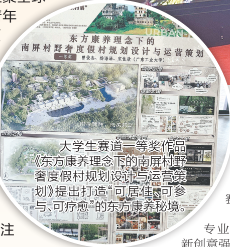
大学生赛道一等奖作品《东方康养理念下的南屏村野奢度假村规划设计与运营策划》提出打造“可居住、可参与、可疗愈”的东方康养秘境。