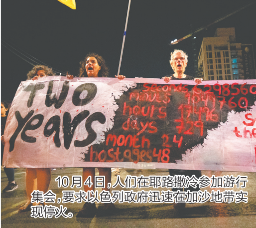
10月4日,人们在耶路撒冷参加游行集会,要求以色列政府迅速在加沙地带实现停火。