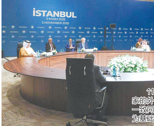
11月3日,土耳其、沙特阿拉伯、约旦等7个国家的外交部长在土耳其伊斯坦布尔举行会议,各方一致同意维护加沙停火协议,并推动以“两国方案”为基础的持久和平进程。