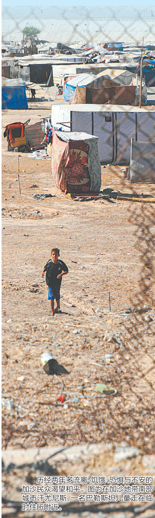
历经两年多流离、饥饿、恐惧与不安的加沙民众渴望和平。图为在加沙地带南部城市汗尤尼斯,一名巴勒斯坦儿童走在临时住所附近。