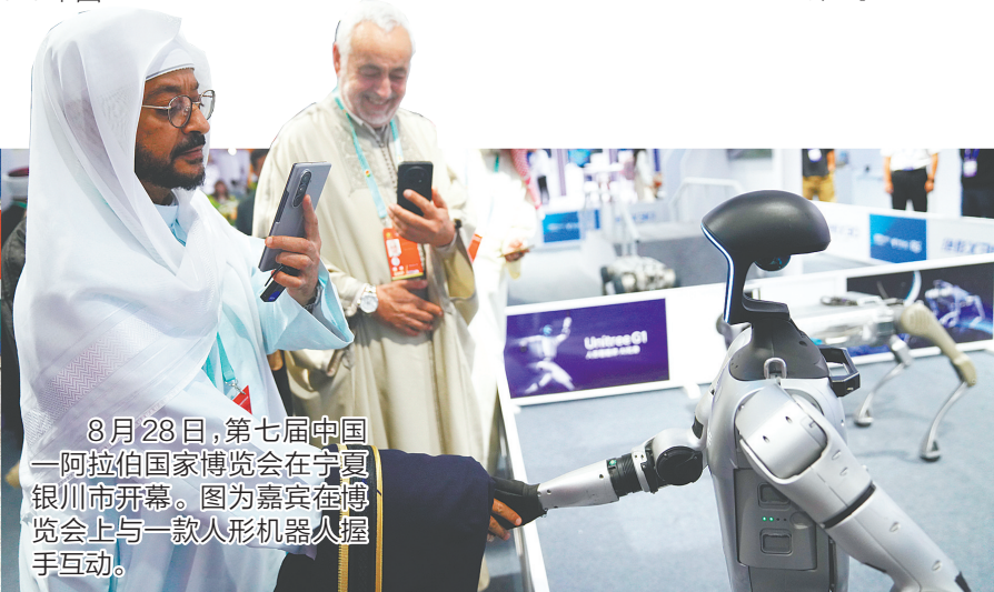
8月28日,第七届中国—阿拉伯国家博览会在宁夏银川市开幕。图为嘉宾在博览会上与一款人形机器人握手互动。