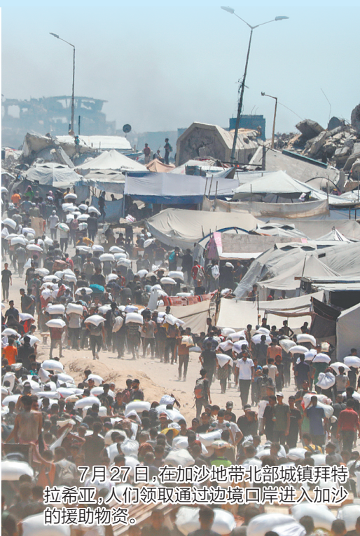
7月27日,在加沙地带北部城镇拜特拉希亚,人们领取通过边境口岸进入加沙的援助物资。

逾7万人殒命,17万多人受伤,近200万人流离失所。据巴勒斯坦卫生部门统计,至今仍有约1万人的遗体被埋在废墟之下。 历经两年多的轰炸与逃亡,见证太多生离死别,巴以民众终于在今年10月9日等来了翘首以盼的第一阶段停火协议。 在这片长期被战争撕裂的土地上,和平真的到来了吗? 停火协议第一阶段接近尾声,能否进入第二阶段尚存变数。零星冲突时有发生,紧张对峙并未消散。 维持脆弱停火或是以色列的选项。以色列区域外交政策研究所首席研究员罗埃·基布里克接受记者采访时坦言,最符合以色列右翼政府战略利益的局面,或许并非真正的和平,而是让冲突处于可控的低烈度状态。 美国的偏袒给了以色列“底气”。目前的停火协议允许以色列在美国同意的情况下,对“涉嫌破坏停火安排的”巴勒斯坦伊斯兰抵抗运动(哈马斯)目标采取有限军事行动。基布里克说,在以色列看来,这不算“重启战争”,而是协议框架下的“必要行动”。 中东地缘格局正发生结构性重塑。伊朗实力被严重削弱,叙利亚政权更替,黎巴嫩真主党遭受重创……以色列特拉维夫大学副校长埃亚勒·齐塞尔说,以色列得到美国支持,同时地区力量又无法开展有效制衡。 记得2023年最后一个夜晚,我站在以色列国防部前的广场上。全球多地的人们当时正兴奋地为新年到来倒计时读秒,我面前的大屏幕显示的却是战火已经燃烧多少天、多少小时、多少分钟、多少秒。零点到来,手机突然不停震动。那不是新年祝福信息,而是弹窗预警。防空警报声中,夜空里留下火箭弹遭拦截后的缕缕火光。 两年过去,又是一年岁末。战争只是被按下暂停键,却还未画上句号。长期积累的矛盾难以解开,社会与人心的撕裂仍在延续,地缘政治的板块依旧激烈碰撞。 当2026年零点钟声响起,这片土地等待的,仍将是一个个充满未知的明天。