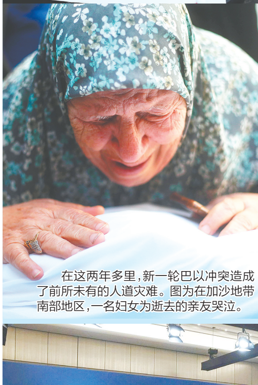
在这两年多里,新一轮巴以冲突造成了前所未有的人道灾难。图为在加沙地带南部地区,一名妇女为逝去的亲友哭泣。