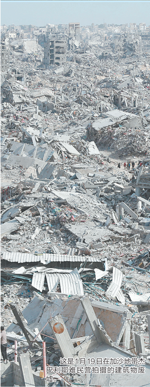
这是1月19日在加沙地带杰巴利耶难民营拍摄的建筑物废墟。