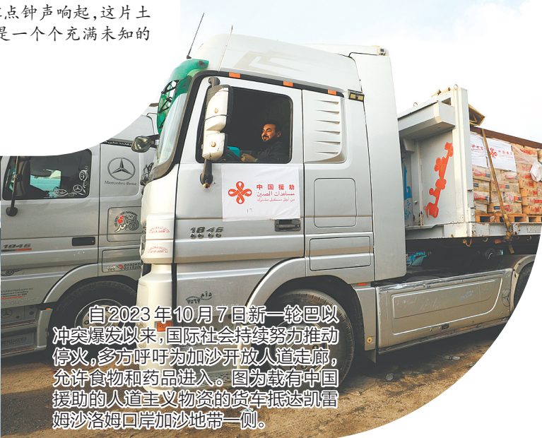
自2023年10月7日新一轮巴以冲突爆发以来,国际社会持续努力推动停火,多方呼吁为加沙开放人道走廊,允许食物和药品进入。图为载有中国援助的人道主义物资的货车抵达凯雷姆沙洛姆口岸加沙地带一侧。