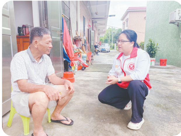
通过走街串巷、入户探访,选调生逐渐熟悉村情民意、融入当地生活,为开展基层工作打好基础。