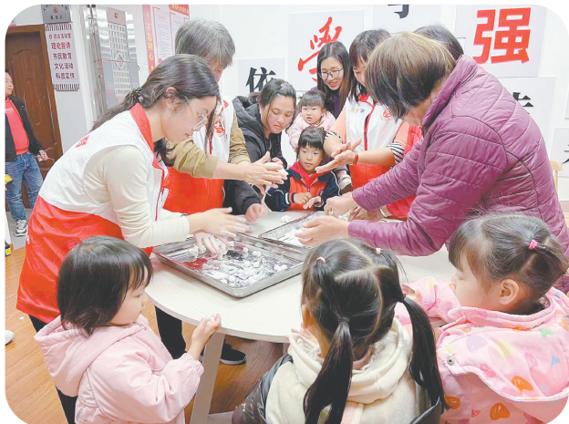
选调生牵头组织元宵节主题活动,与乡亲们一同搓汤圆、话团圆。