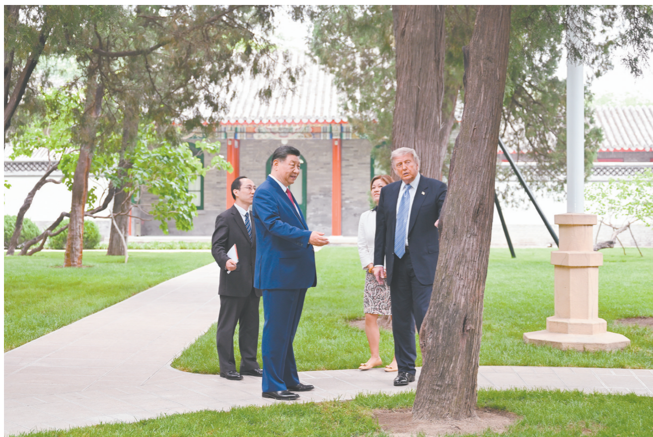
5月15日上午,国家主席习近平在中南海同美国总统特朗普举行小范围会晤。这是特朗普抵达时,习近平热情迎接。

新华社北京5月15日电 5月15日上午,国家主席习近平在中南海同美国总统特朗普举行小范围会晤。