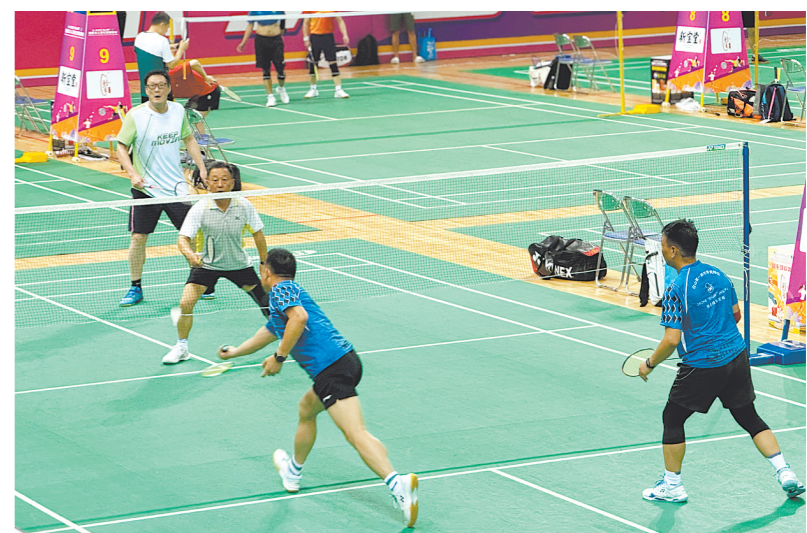
侨胞们在赛场上努力拼搏,一展风采。

江门日报讯(文/图 记者/李嘉敏)5月15日至17日,2026年“台山杯”国际华人羽毛球精英赛在台山新宁体育馆举行,赛事共吸引世界各地1300余名华人羽毛球运动员参赛,成为凝聚侨心、展示侨乡风貌的重要平台。