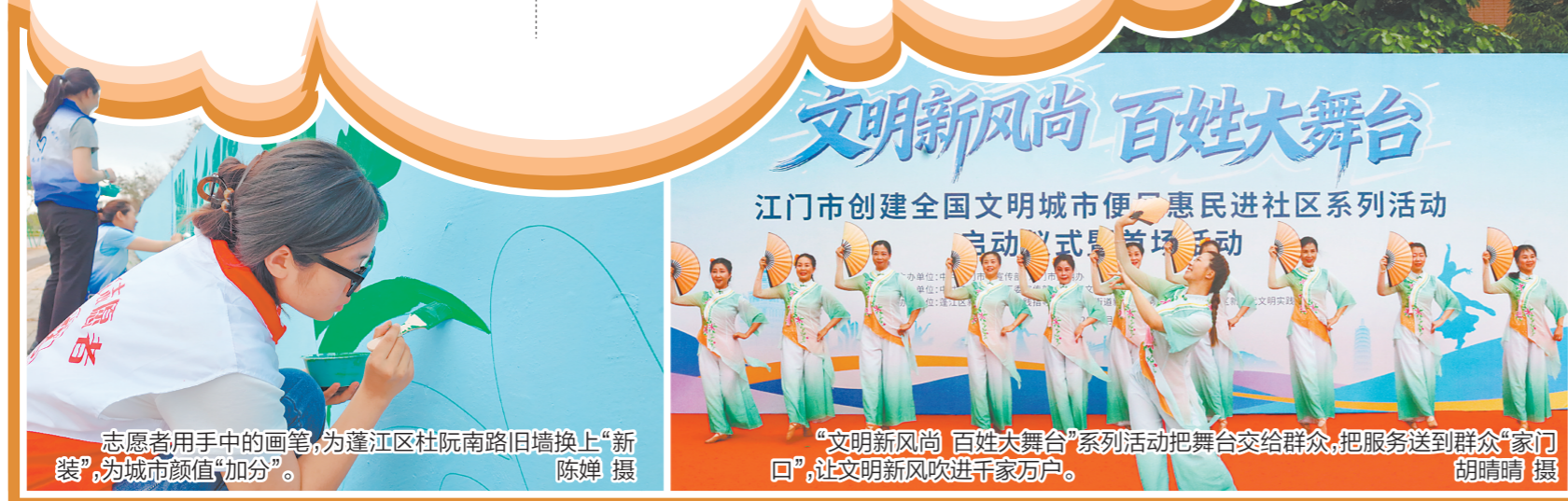
志愿者用手中的画笔，为蓬江区杜阮南路旧墙换上“新装”，为城市颜值“加分”。

“无感”的浸润，是将文明嵌入城市运行的毛细血管；“有感”的文明，是让每一位市民都能触摸到城市的温度与美好。江门，正以久久为功的定力，书写着一座文明城市最动人的答卷。