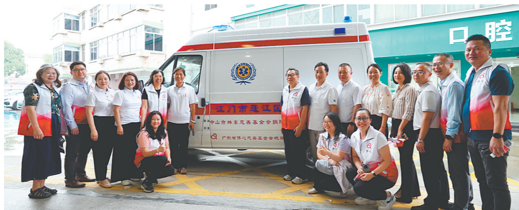
基金会向杜阮镇卫生院捐赠救护车。