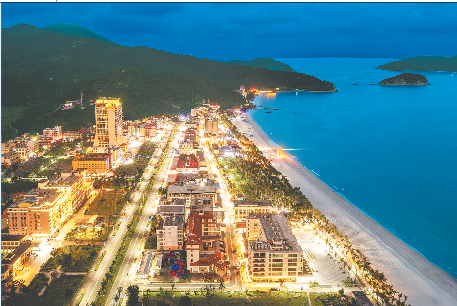
川岛镇聚力4A级景区升级,精雕椰林沙滩滨海风光,完善游乐、休憩等配套,打造滨海度假标杆。