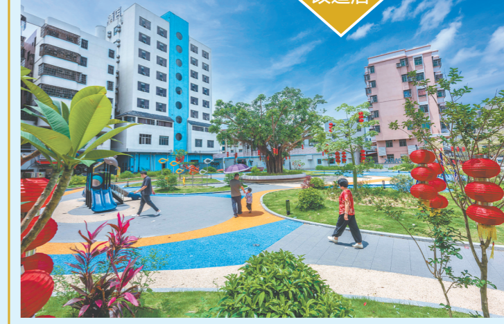
升级改造后的三洲海滨公园,增加特色景观及娱乐设施,打造成具有滨海特色的绿美生态小公园。