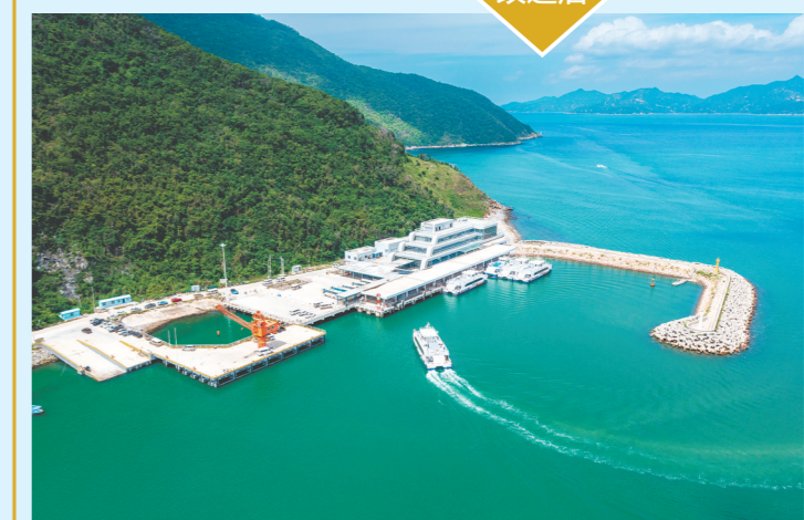
升级改造后的独湾码头,泊船、安检、便民服务等功能进一步优化,提升群众出行与旅游通行效率,助力海岛全域发展。