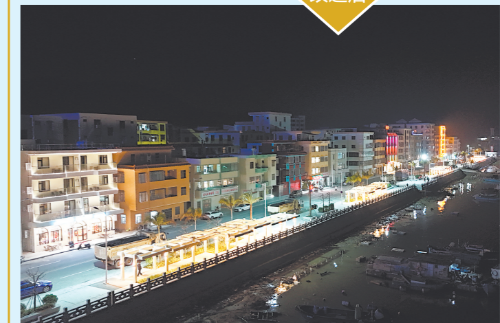
示范主街优化沿线道路风貌,升级改造房屋外立面,建成兼具颜值与内涵的滨海风情示范主街。