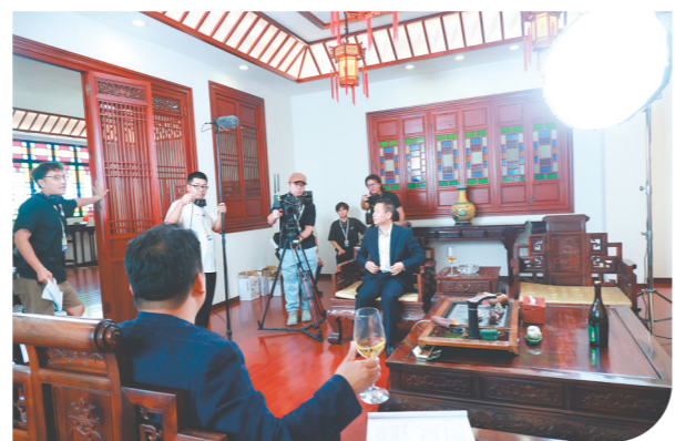
↑本土短剧《机车的轮子滚动百年碉楼密码》拍摄中。 ←本土短剧《陈皮密码》拍摄中。