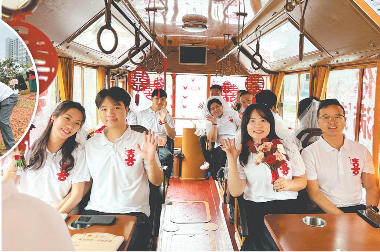
新人们搭乘“铛铛车”欣赏侨乡风貌,沿途向市民派发喜糖,分享新婚喜悦。

江门日报讯(文/图 记者/李嘉敏)昨日上午,台山市福美山公园内爱意满满,“植”因有你,幸福满“栽”2026年台山市“5·20”集体婚礼主题活动在这里浪漫举行,9对新人携手奔赴这场专属的浪漫之约。