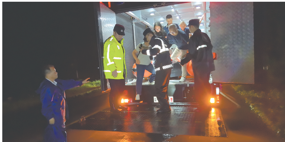
群众乘坐台山公安巡特警大队特种装备车转移至安全接驳点。

考虑到暴雨可能持续,水位可能仍有上涨风险,现场救援人员决定先将全部乘客转移至距离最近的潮境村委会临时安置。至22时14分,白沙派出所民警、白沙镇政府工作人员、交警白沙中队队员共同配合,车上19名乘客全部被安全转移至潮境村委会。在村委会临时安置