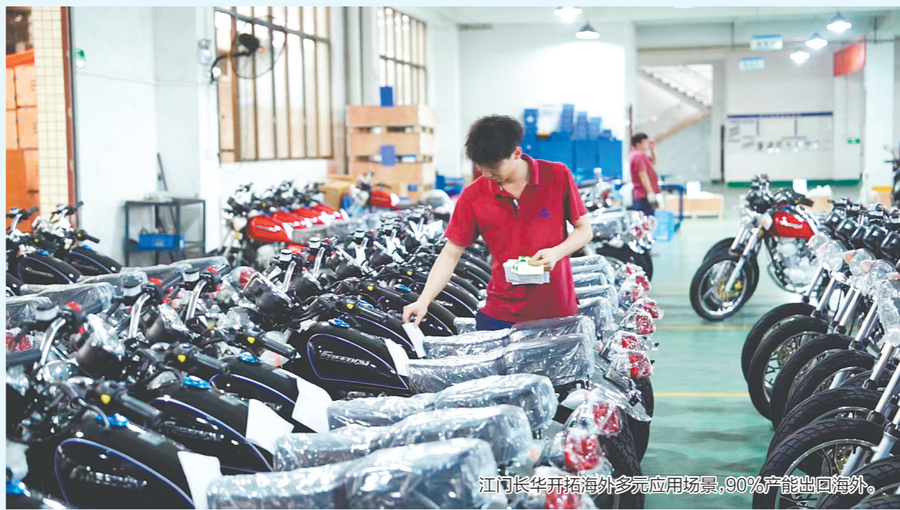
江门长华开拓海外多元应用场景，90%产能出口海外。