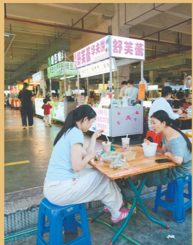
夜市摊位整齐排列,为市民行走和餐桌摆放腾出充足空间。