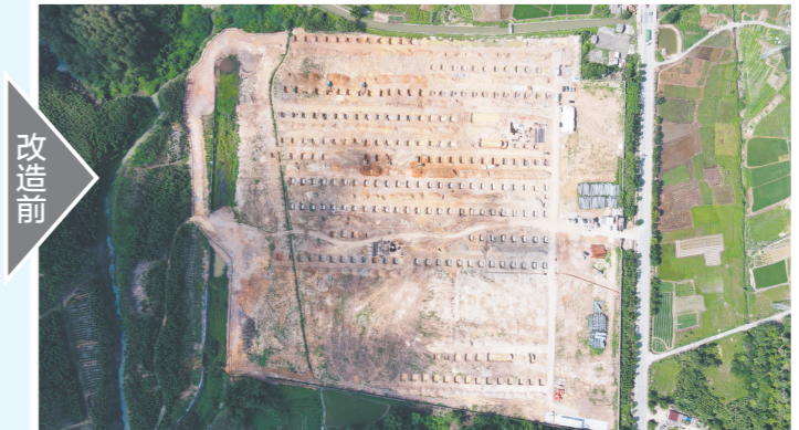
昔日闲置土地,已成为厂房林立、配套完善的绿色建筑产业园。