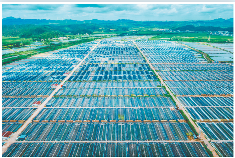
大亨渔场1360亩小塘养殖助力村集体增收。