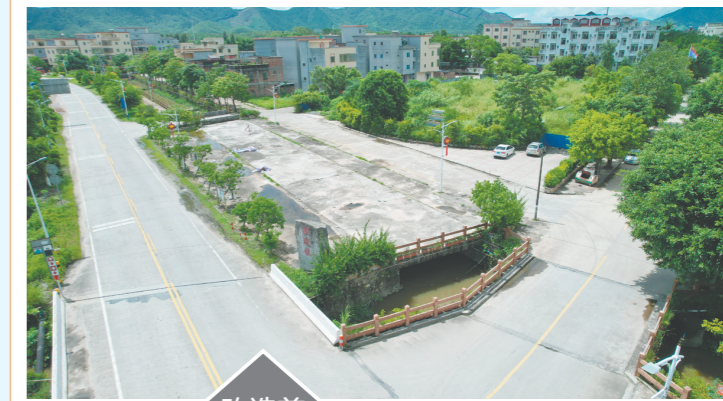
经过改造,圩镇面貌大大提升。