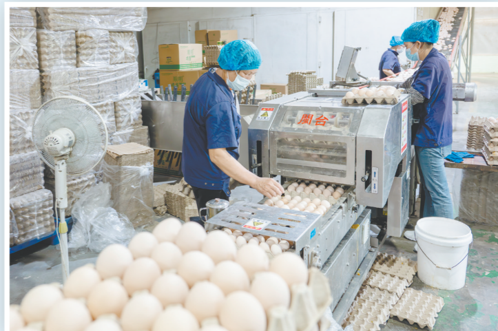
振兴(恩平)农场供港澳鸡蛋日产32万枚。