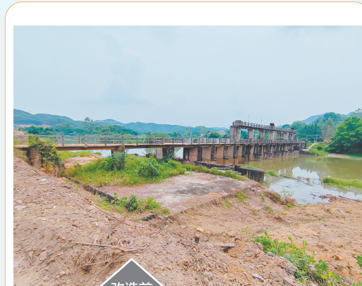
蓝田水闸惠及蓝田、大亨、元山、围边4个村约6705亩稻田的日常农业生产用水供给。