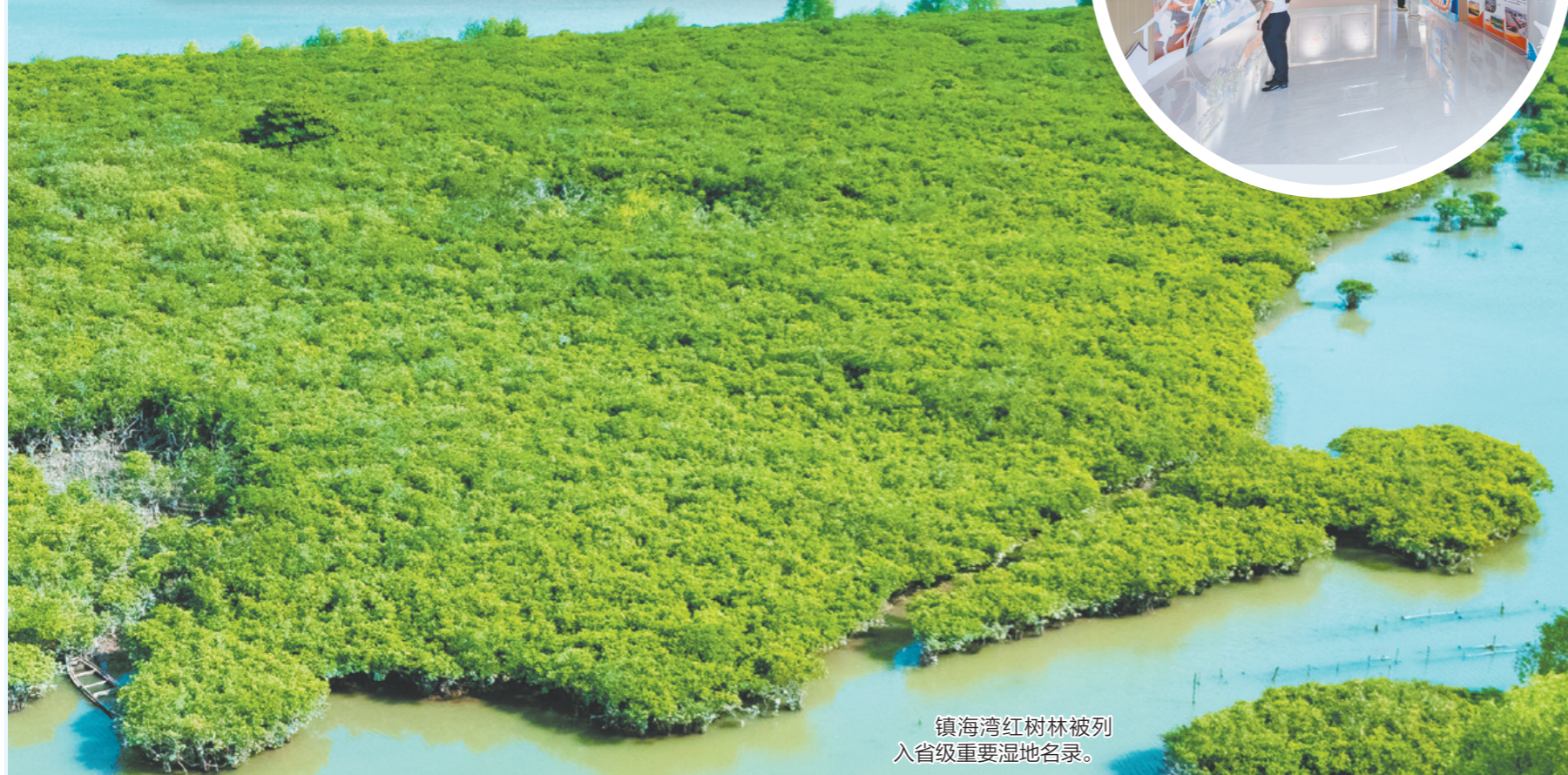
镇海湾红树林被列入省级重要湿地名录。