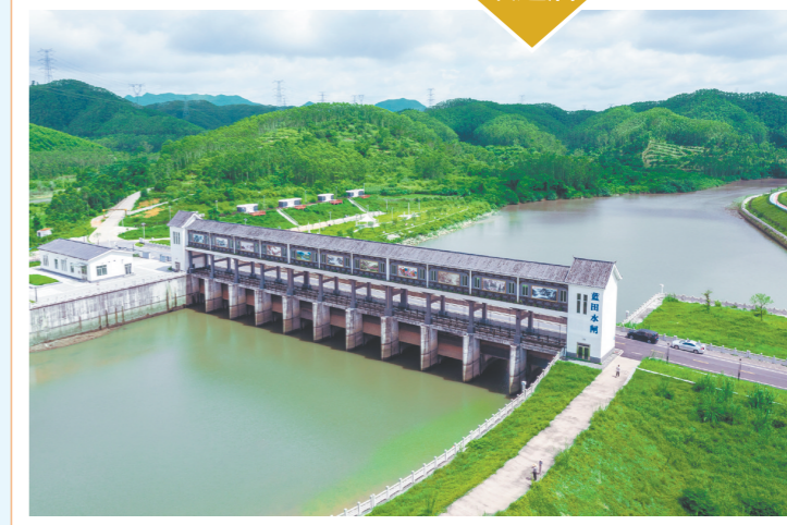
蓝田水闸惠及蓝田、大亨、元山、围边4个村约6705亩稻田的日常农业生产用水供给。