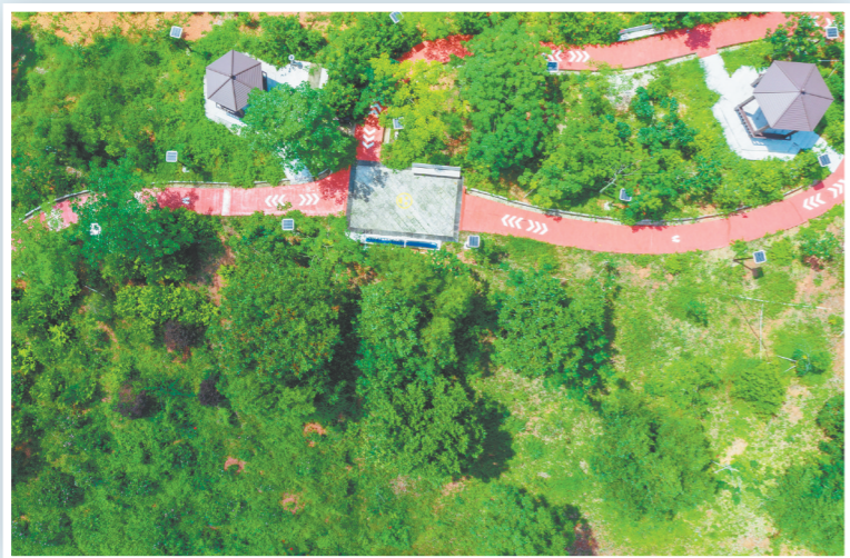
绿意盎然的生态小公园。