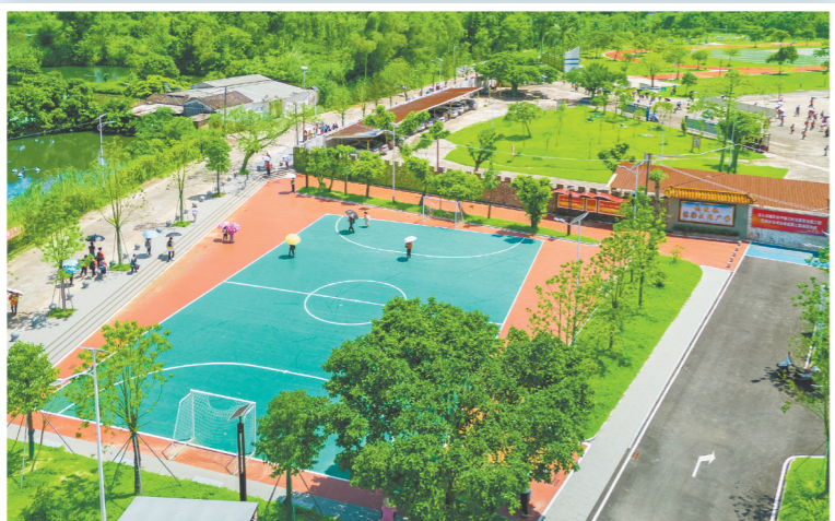
法治公园环境优美。