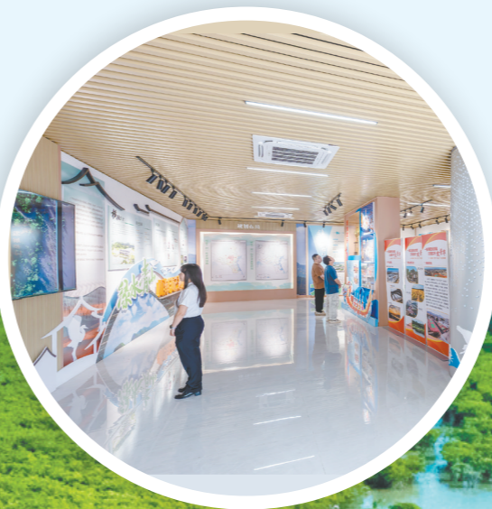
→圩镇客厅成为展示横陂发展成就的窗口。