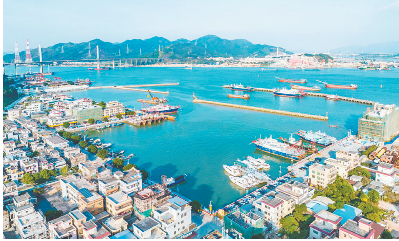
崖门镇从“渔农小镇”走向“海洋强镇”。

这组数字带来的化学反应，远比“人多了一点”来得深刻：消费层面，麦当劳、瑞幸、蜜雪冰城、古茗等连锁品牌相继入驻崖门钧融汇商业体。2026年元旦，麦当劳崖门得来速餐厅开业，首日即迎客流高峰——品牌