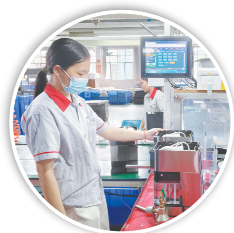
每一台机器下线前,都要经过严格的压力测试、漏水测试和萃取测试。

未来,企业将依托生产、技术与口碑优势,在小家电领域稳步进阶,助力台山制造业高质量发展。