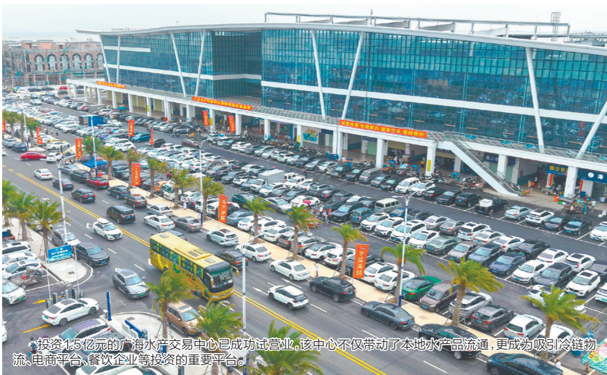
投资1.5亿元的广海水产交易中心已成功试营业,该中心不仅带动了本地水产品流通,更成为吸引冷链物流、电商平台、餐饮企业等投资的重要平台。

招商环境的重要“催化剂”。广海镇拥有千年“海丝”文化和优质滨海生态资源,如何深挖文旅项目潜力吸引投资?