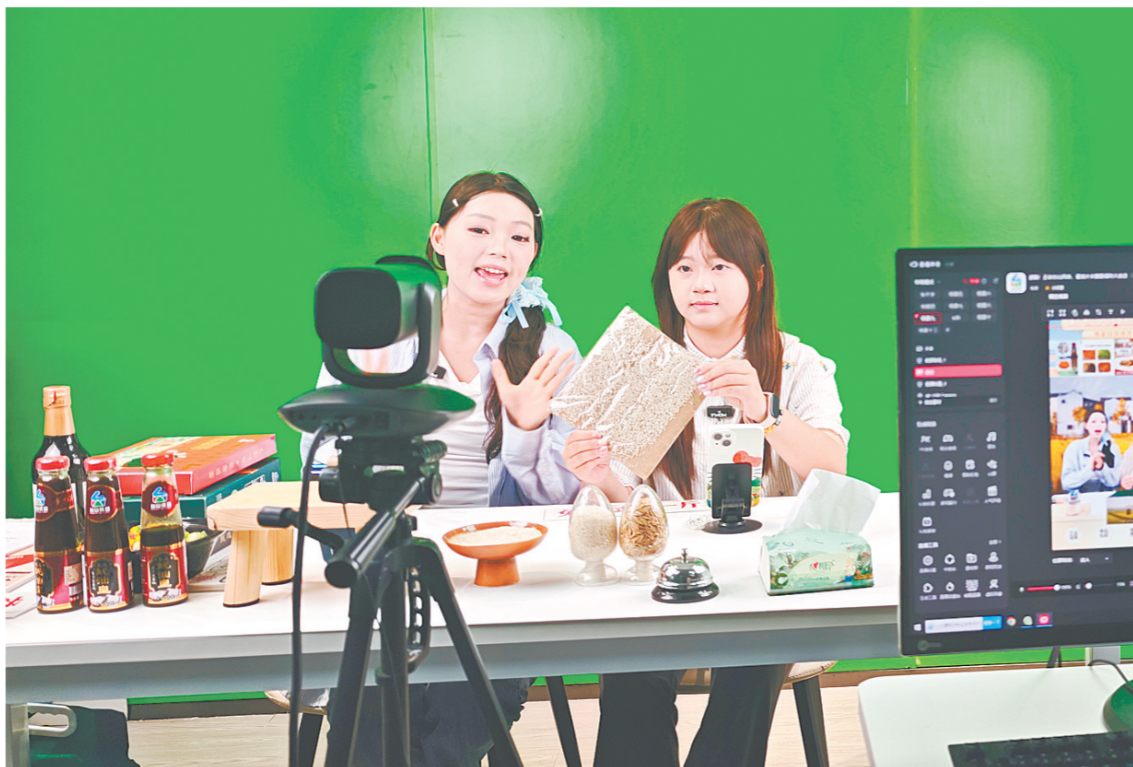
广科院派出专业团队全面负责“台山优品”线上店铺运营管理，涵盖产品上架、文案策划、直播带货、品牌推广等全流程。