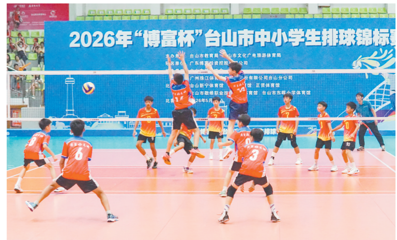
一场校园排球赛事，再次让外界聚焦台山这个底蕴深厚的“排球之乡”。