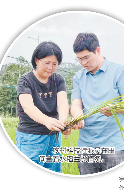
农村科技特派员在田间查看水稻生长情况。

下一步，台山市将持续深化与各大高校、科研院所的深度合作，充分发挥农村科技特派员及工作站的技术优势与平台作用，持续提升农业科技创新和基层服务能力，以硬核科技赋能农业提质、农民增收、乡村增效，全力护航农业农村现代化建设。