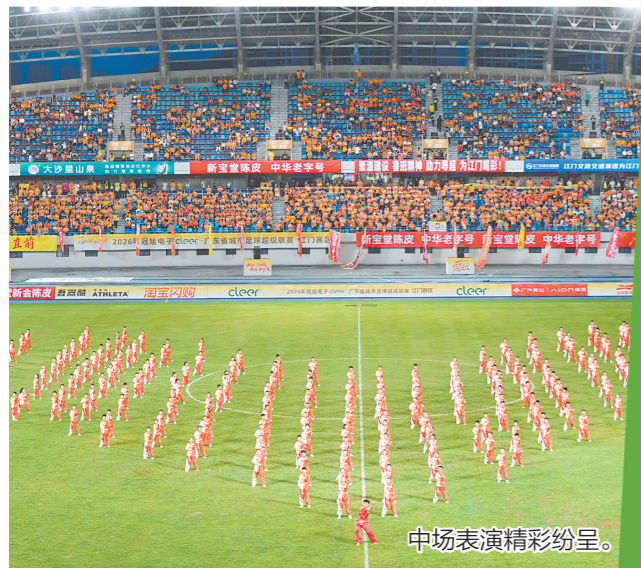
中场表演精彩纷呈。