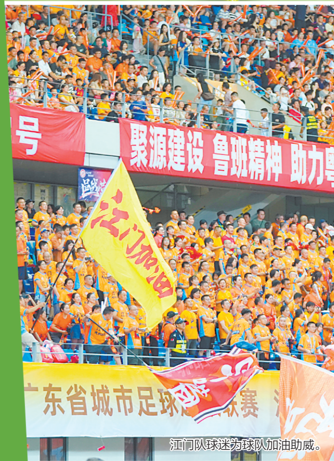
江门队球迷为球队加油助威。

据了解，依托粤超主场赛事，江门持续探索“体育+文化+旅游”融合发展路径，不断刷新主场赛事的体验感与传播度。一场场充满烟火气与人情味的足球盛宴，不仅激活了城市的运动基因，更成为展示侨都形象、深化城际文化交流的重要窗口。