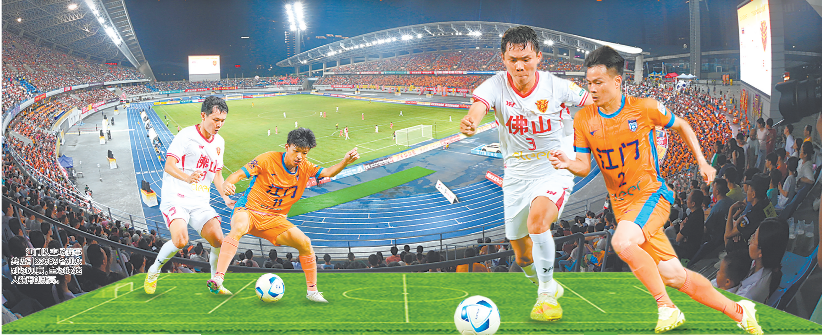
江门队主场赛事共吸引23669名观众到场观赛，主场球迷人数再创新高。