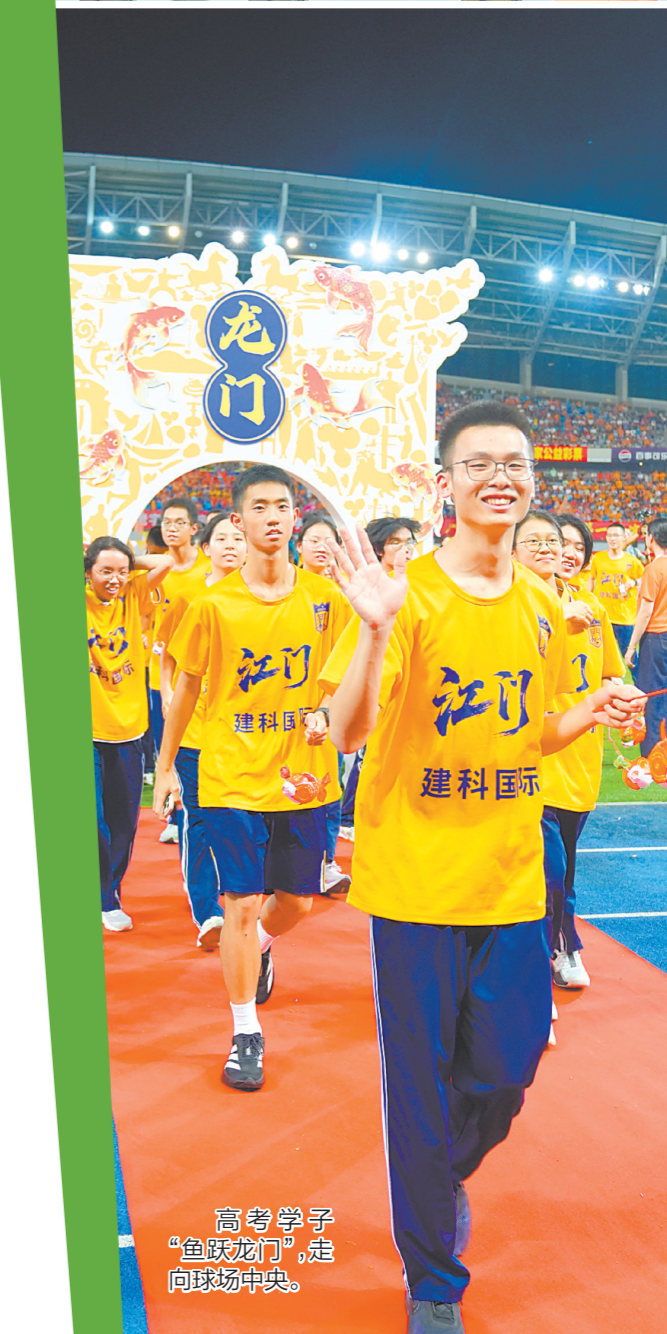
高考学子“鱼跃龙门”，走向球场中央。

绿茵场上呐喊阵阵，非遗展位烟火气浓浓。此次活动以体育为纽带，让江门非遗走出展厅、走进大众，让侨乡文脉在赛场边焕发新生。