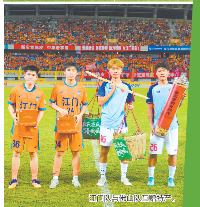
江门队与佛山队互赠特产。