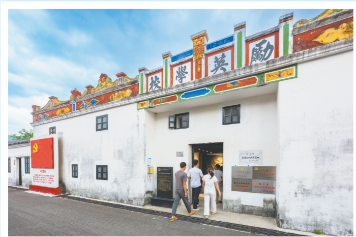
↑ 广东人民抗日解放军司令部驻地旧址是县级文物保护单位、江门市爱国主义教育基地。