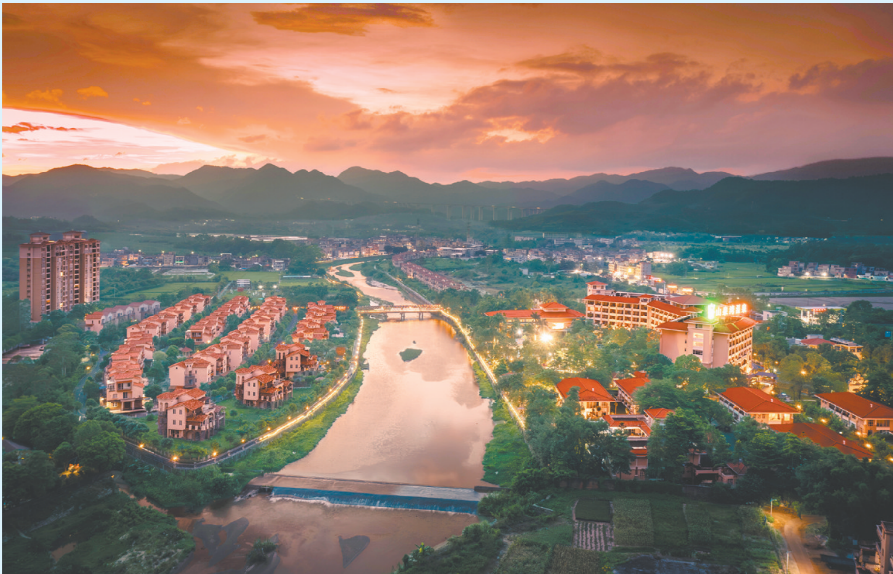
山泉湾温泉城是国家4A级旅游景区。