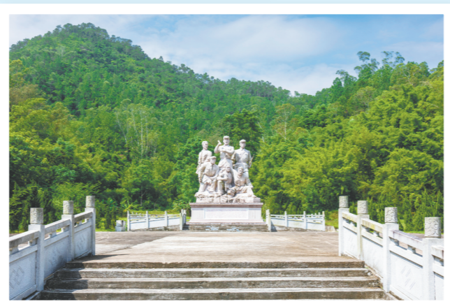
↑ 镬盖山六壮士公园是江门市党员教育基地。