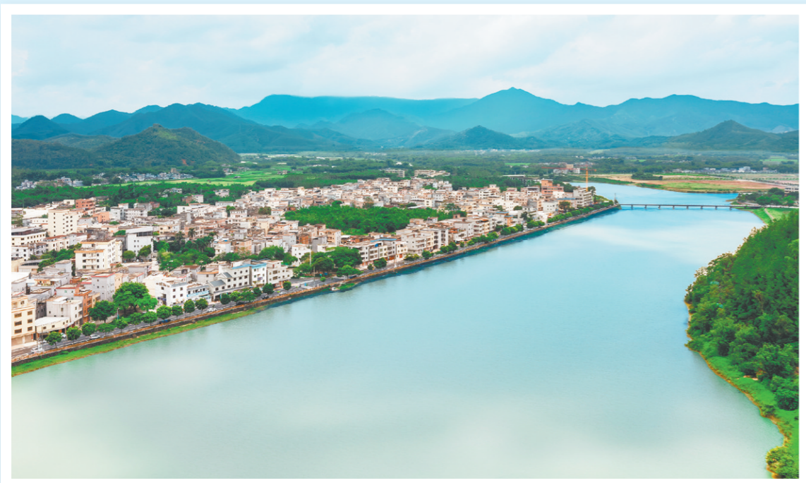
← 大田镇 偎依在美丽的 锦江河边。