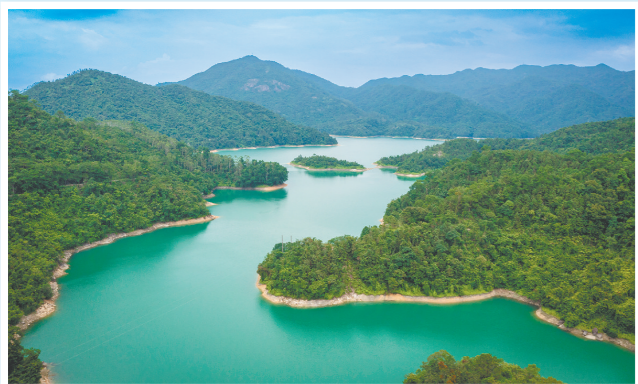
↓ 锦江水库是江门最大的水库，水质常年稳定在地表水Ⅱ类及以上标准。