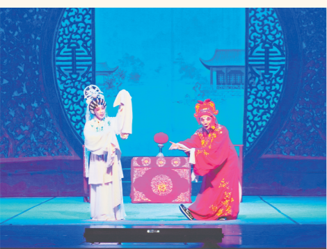
新式粤剧《乌龙院·活捉三郎》以年轻化舞台表达，吸引年轻观众。